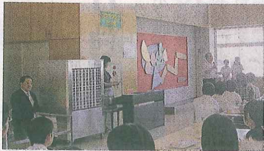
伊藤忠丸紅スチールAPが 販売する涼風装置を寄贈

伊藤忠丸紅鉄鋼は、 文部科学省の「東日本 大震災、子どもの学び 支援ポータルサイト」 を通じて岩沼市教育委